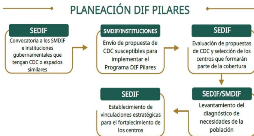
Figura 28. Proceso de planeación para el Programa DIF Pilares